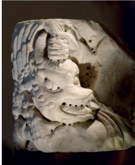
Relleu de l'abadia de la Grassa, 1157-1167 Abadia de Santa Maria d'Orbieu, la Grassa (Aude)