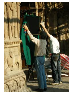
Imatges del procés d'escaneig de la portada de Ripoll

Després d'un complet escaneig de la portada, les dades d'alta resolució s'han processat a fi de generar un model informàtic especialment dissenyat per a l'ocasió. A Barcelona i a Pisa, un equip de 10 investigadors ha participat en